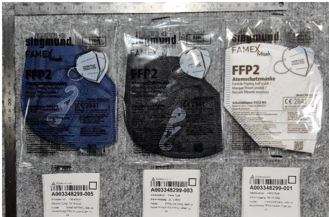
Bild / Picture 1: Masken – kleinste Verpackungseinheit / masks smallest packaging unit