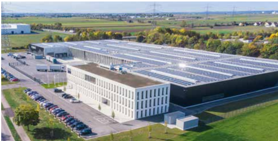
Bernd Siegmund GmbH, Oberottmarshausen

Neue reduzierte Einkaufspreise – diesen Vorteil geben wir an Sie weiter