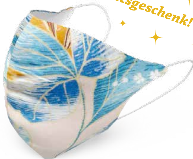
Beispiel für Erwachsene