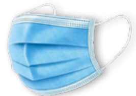
MNS Typ I und Typ II R