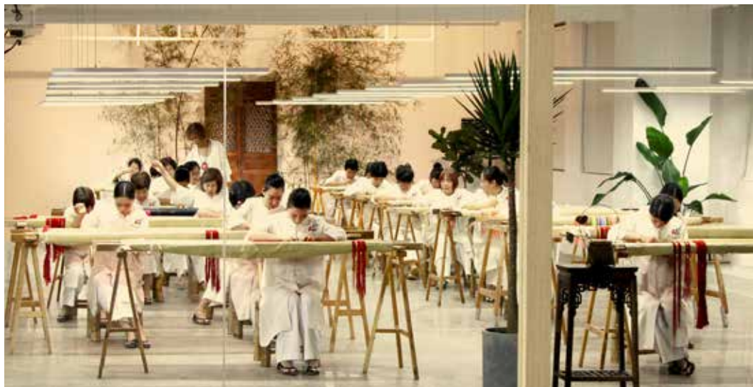
Einblick in das Design-Studio unseres Seidenmaskenherstellers