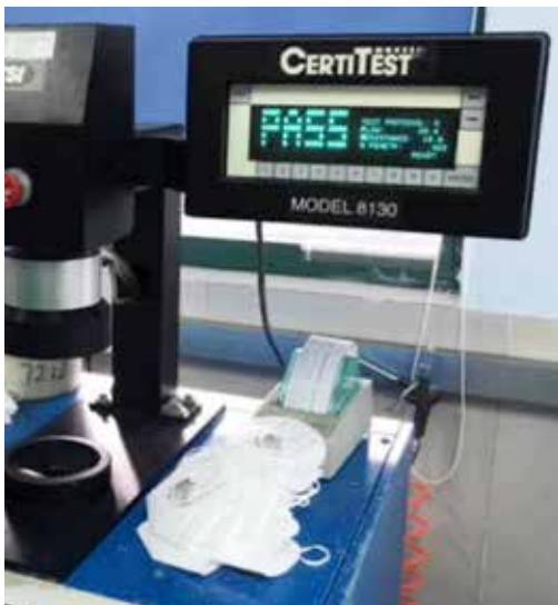
Qualitätskontrolle KN 95-Maske