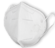
KN95 / FFP2